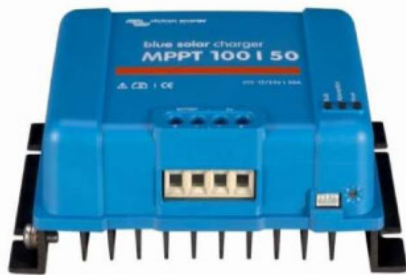
Solar Charge Controller MPPT 100/50